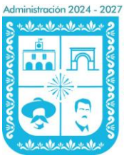
TABLA DE ACTUALIZACIÓN Y CONSERVACIÓN DE LA INFORMACIÓN PÚBLICA DERIVADA DE LAS OBLIGACIONES DE TRANSPARENCIA COMUNES

SUJETO OBLIGADO: AYUNTAMIENTO DE SANCTÓRUM DE LÁZARO CÁRDENAS, TLAXCALA